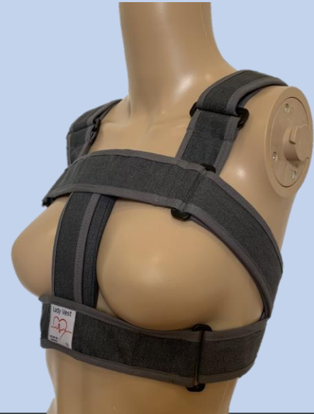
Primer Chaleco Torácico diseñado teniendo en cuenta las características físicas y funcionales del tórax femenino