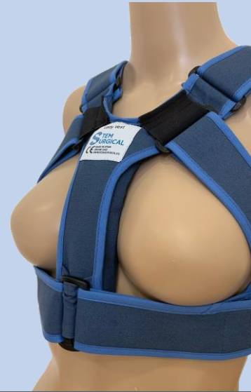
Primer Chaleco Torácico diseñado teniendo en cuenta las características físicas y funcionales del tórax femenino